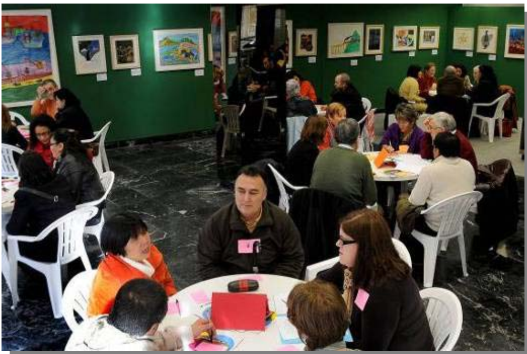
World Café de Getxo CON VIVENCIAS 20 de diciembre de 2008.